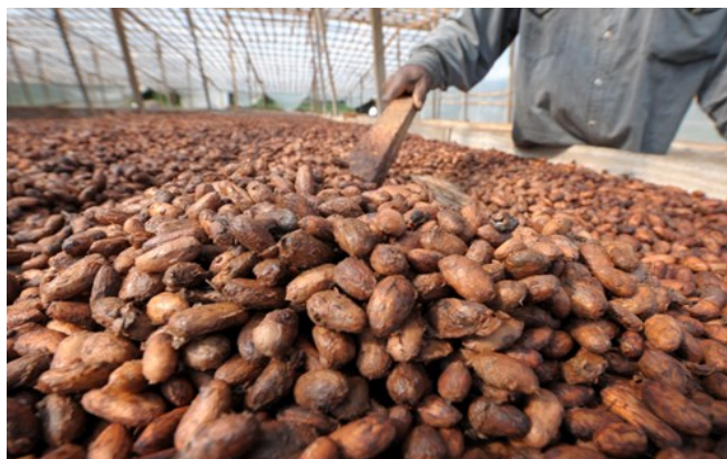
Produkcja czekolady na Wybrzeżu Kości Słoniowej.

Niestety, ta historia ma też czarną stronę. Choć niewolnicze plantacje, które założyli Francuzi, Brytyjczycy i Amerykanie już od dawna nie istnieją, potomkowie dawnych niewolników w wielu przypadkach żyją w nędzy. Z wyjątkiem tych, którzy po swoich dawnych panach przejęli majątki. Potomkowie tamtych to dziś bogacze. Ale aby to dobrze zrozumieć, musimy popatrzeć na małe państewko w Afryce – Wybrzeże Kości Słoniowej. Pozornie nic złego się tam nie dzieje. Ale jeśli popatrzymy na statystyki, to zaczyna się robić niepokojąco. Siedemdziesiąt procent mieszkańców pracuje w rolnictwie. Ale aż 80 % ich mieszkańców żyje w nędzy. Państwo to jest największym eksporterem czekolady na świecie. Dla tych, którzy jeszcze się nie domyśli-li – około 20 milionów mieszkańców Wybrzeża Kości Słoniowej to ubodzy rolnicy, którym zabiera się plony i nie płaci prawie nic. Sytuacji nie pomaga fakt, że w tym kraju co chwilę wybuchają zamachy stanu, wojny domowe, rewolucje czy bunty niższych klas społecznych. Więc następnym razem, gdy zjesz trochę czekolady, pamiętaj, proszę, o historii. Pamiętaj o Aztekach, o Hiszpanach, o Koloniach i o Wybrzeżu Kości Słoniowej. Smacznego!!!